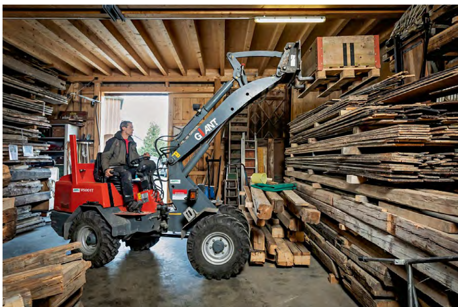
Altholz ist ein begehrtes Gut.