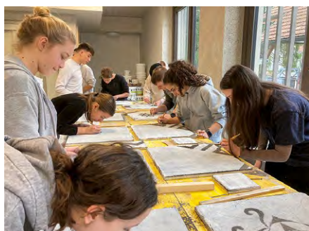
2022 fand ein Pilotkurs mit Studierenden der Pädagogischen Hochschule TG statt. Die künftigen Lehrer:innen lernen die Handwerkstechnik des Stukkateurs kennen, fertigen ein Sgraffito an und lernen Baukultur kennen.