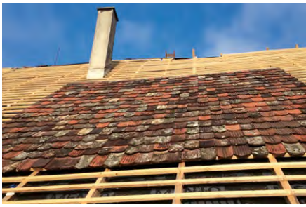
Lebendige Dacheindeckung unter Verwendung einer Ziegelmischung aus dem Bauteillager Ostschweiz.

Bei uns geht es effektiv darum, dass wir vom Bauteillager ein Haus vor dem Abbruch ausräumen können, damit der Bagger nicht alles in die Mulde wirft. Es geht uns ums Recycling, das Wiederverwenden – wobei es eigentlich ein höheres Recycling ist, weil bei uns nicht nur der Rohstoff, sondern das ganze Bauteil wiederverwendet wird. Es geht also eher um ein Upcycling. Und die Bauherrschaft hat ein bisschen weniger Abfall.